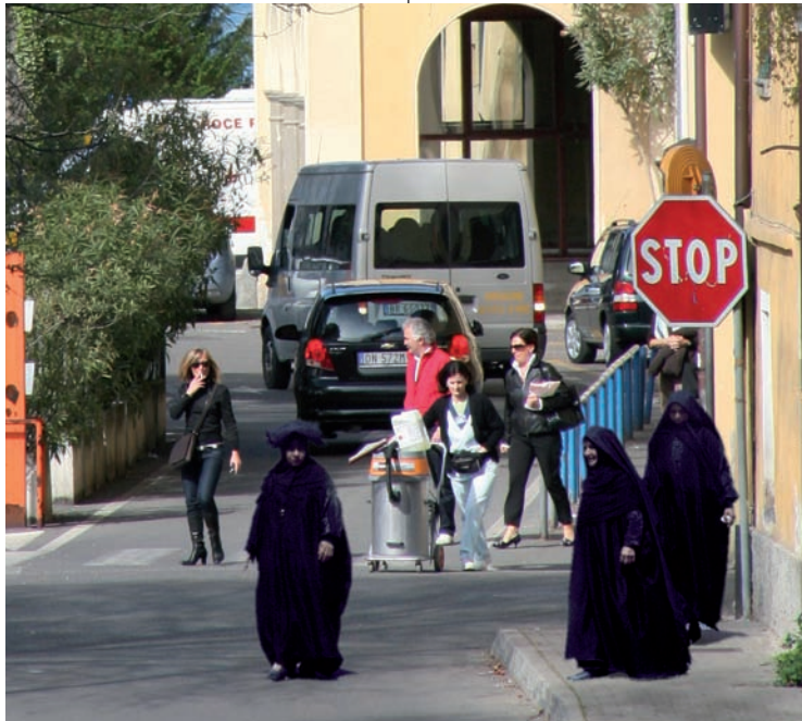
Non c'è posto migliore che l'ingresso all'ospedale per assistere ad un andirivieni di personaggi dai costumi a dir poco arcaici.

Parliamo di noi, soprattutto del nostro futuro e dell'avvenire dei nostri figli.