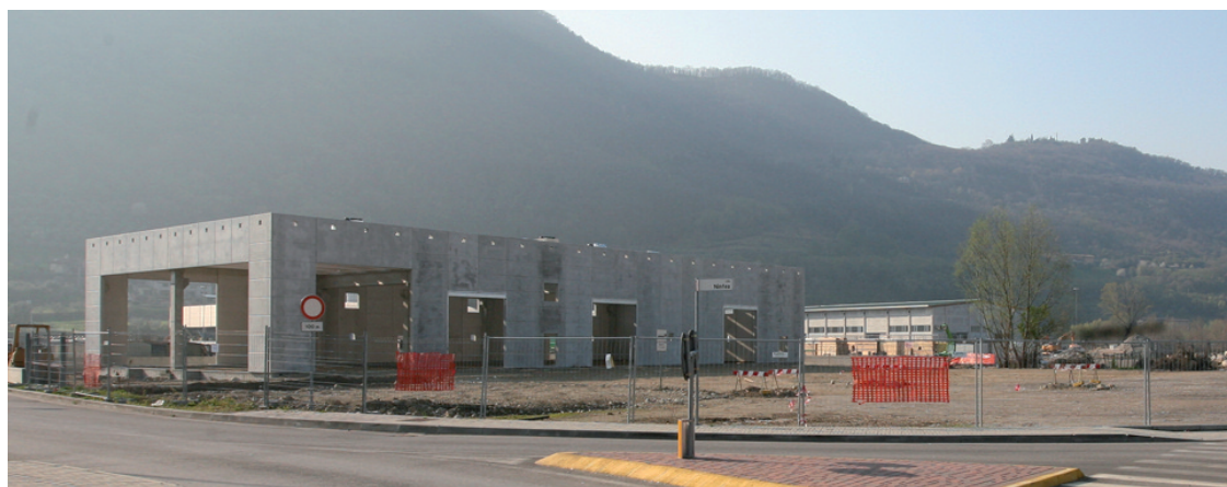
Due aspetti che sottolineano scarsa sensibilità verso il paesaggio (sopra) e interventi per migliorare la viabilità (sotto).

Via Martiri della Libertà è la strada che diramandosi da via Roma scende all'Ospedale e capita di fre-