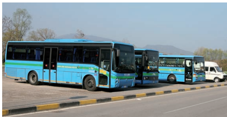
Torpedoni, automobili e camper si contendono parcheggi sempre più rari

per tre campeggi, disseminata di buche, cassonetti in ordine sparso e aree di parcheggio utilizzabili solo a metà. La riqualificazione di viale Repubblica ha comportato il ricollocamento, qua e là, delle fermate dei pullmann di linea; fra queste quella di viale Europa, in prossimità della curva con via Gorzoni, rappresenta un pessimo esempio di progettualità. E' sufficiente transitare negli orari di arrivo degli studenti per vedere il marasma in cui precipita quell'area: file di ragazzi che attraversano la strada in ordine sparso e